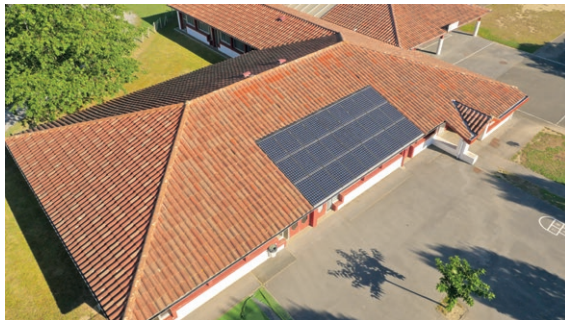
Installation solaire sur l'école d'Arrautz à Ustaritz.